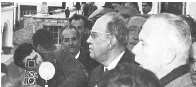
Φωτ. 5 Από την ομιλία του Σοφ. Βενιζέλου στην πλατεία Ελευθερίας

ατελείωτος από άκρου εις άκρον του λιμανιού. Η τοπική επιτροπή της Ενώσεως Κέντρου, με επικεφαλής, τον άμεσο συνεργάτη «συντονιστή» του προεκλογικού αγώνα Μιχάλη Κουγιουμτζή, καλωσόρισε τον πρόεδρο με σύντομη προσφώνηση. Ακολούθησε η μετάβαση τους στην Πλατεία Ελευθερίας, και στην Αίγλη. Οι εκδηλώσεις αγάπης του κόσμου ήταν συγκλονιστικές. Από το μπαλκόνι της Αίγλης ο Σοφοκλής Βενιζέλος απευθύνθηκε στο λαό της Κω, σε μεγαλειώδη συγκέντρωση.