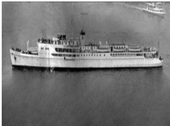
Φωτ. 3 Το ατιμόπλοιο «Ελλάς»

Στη κορύφωση του προεκλογικού αγώνα ο Σοφοκλής Βενιζέλος, φθάνει στην Κω. Σε λίγες μέρες ολοκληρώνεται η