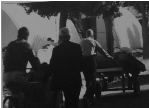
Φωτ 1. Διακρίνονται τα σιδερένια τολλ: Στρατιωτικά παραπήγματα, στα οποία μετά τον πόλεμο διέμεναν άστεγοι Κώοι. Δύο οικογένειες ανά τολλ.