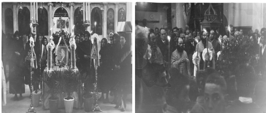
Φωτ. 7 & 8 Από την επιμημόσυνη δέηση στον Μητροπολιτικό Ναό Αγ. Νικολάου την ημέρα της κηδείας του Σοφ. Βενιζέλου.

Για τρεις ημέρες ο Σταμάτης Μανούσης δεν ήθελε να επικοινωνήσει με κανένα. Παροτρυνόμενος από τους συνεργάτες του ξεκίνησε και πάλι τον προεκλογικό του αγώνα.