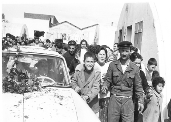
Φωτ. 2 Από την επίσκεψη του Στ. Μανούση στους παραπηματούχους (1963).

Η προσωπική φιλία του νεαρού τότε γιατρού Σταμάτη Μανούση με το Σοφοκλή Βενιζέλο χρονολογείται από 1930. Ως φανατικός υποστηρικτής του Ελευθερίου Βενιζέλου, γρήγορα γίνεται μέλος του Κόμματος των Φιλελευθέρων. Οι δεσμοί ενισχύθηκαν με την ίδρυση της οφθαλμολογικής κλινικής του Σταμάτη Μανούση, στην οδό Νεοφύτου Βάμβα 9, στο Κολωνάκι, η οποία βρισκόταν απέναντι από την κατοικία του Σοφοκλή Βενιζέλου. Συχνές ήταν και οι συναντήσεις μαζί του, μετά τον