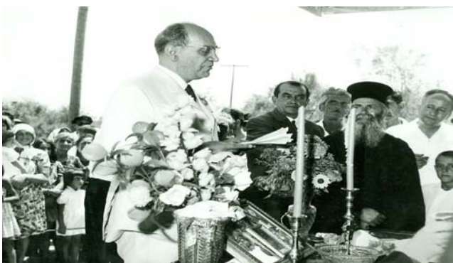
Φωτ. 13 Στιγμιότυπα από την θεμελίωση του Οικισμού «Σοφοκλής Βενιζέλος» στις 25 Ιουλίου 1966.