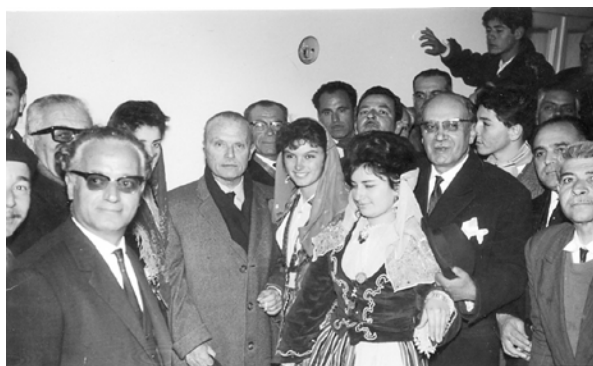
Φωτ. 6 Η υποδοχή του Σοφ. Βενιζέλου στην «Αίγλη».

Στην ολιγόλεπτη ανάπαυση στο σαλόνι της Αίγλης, ο Σταμάτης Μανούσης παρατήρησε ότι ο Πρόεδρος δεν ήταν αυτός που ήξερε. Ήταν ωχρός με ελαφρά εφίδρωση. Κάποιο υπογλώσσιο δισκίο, βοήθησε..... Σε λίγο, αφού συνήλθε ζήτησε να επισκεφθούν, όπως είχε υποσχεθεί τους παρατηρηματούχους στην περιοχή της Λάμπης. Τους επιφυλάχθη θερμή υποδοχή. Επισκέφθη